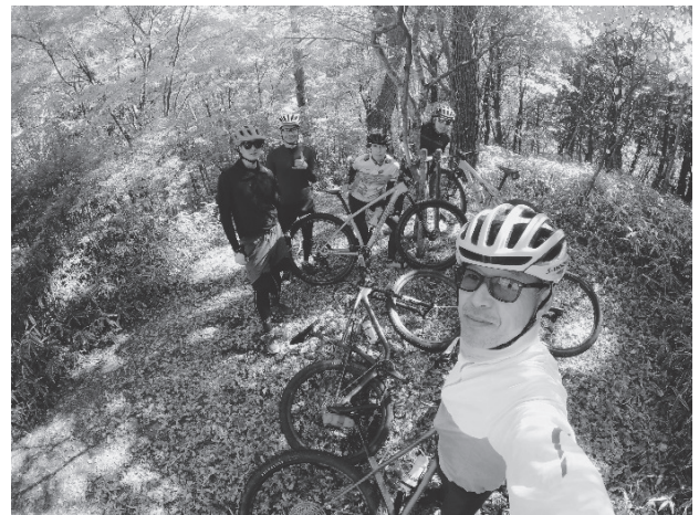
写真-2 山を走る仲間と(今は紅葉がとてもキレイです！)

山では、会社とは違うタイプの方々との出会いがあり、キノコの話から他業界のことまで、色々な話を聞けるのも楽しみの一つです。多忙の時こそ、足を運んでリフレッシュしたいですね！