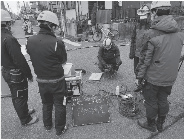
写真-1 ドローンによる管内撮影調査の様子

きました。ここまで自分でやれば、ドローンを飛ばす日にはワクワクせずにはいられません。前日深夜残業でも、調査当日7時前にはハイエースを飛ばして現地へ向かいました。この日はクリスマスでした。男皆して人孔を囲み、ドローンが映し照らし出す管内の様子を眺め、感動していました。映像は本当に感動できるほどの鮮明さでした。初めて見る管内映像には、クラックや侵入水、鉄筋露出など様々な劣化現象が映し出され、ストマネ業務で検討していた管の劣化を始めて目の当たりにしました。