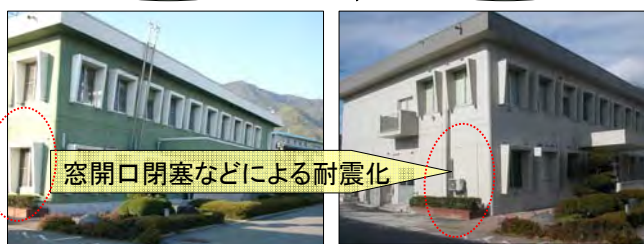
(協力: 上田市上下水道局)