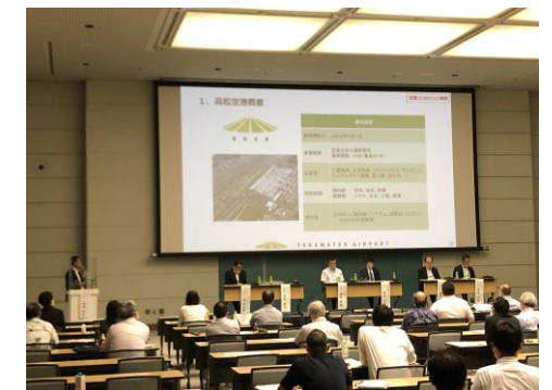
下水道コンセッションを考えるシンポジウム