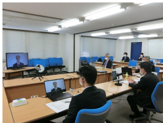
働き方改革セミナーの様子

働き方改革関連法が施行され、水コン協会員の企業においても様々な取り組みが行われています。水コン協では、令和元年度より「働き方改革セミナー」を開催しており、3年度はzoomウェビナーにより行いました。働き方改革の概要および企業の取り組み状況について、会員企業による説明を行い、意見交換しました。