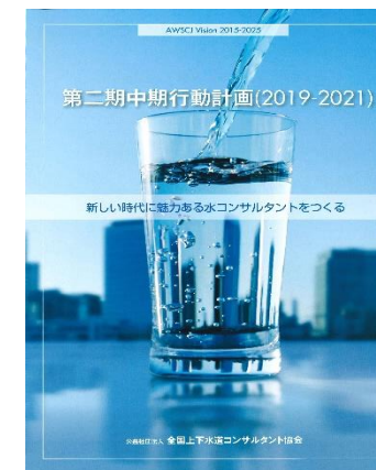
第二期中期行動計画パンフレット