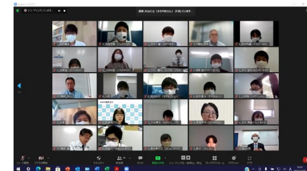
若手社員研修会 (関東支部)