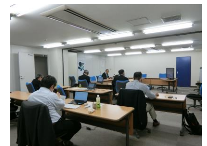
災害時支援者育成講習会