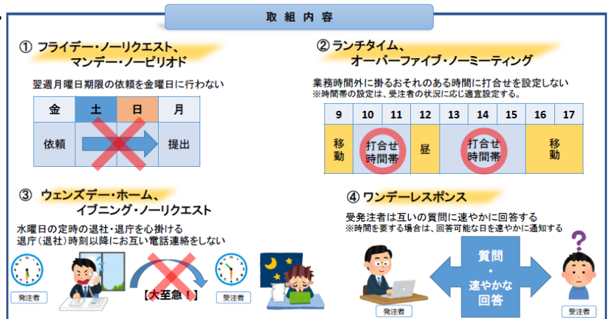
図-1 ウィークリー・スタンスの取組内容

受発注者で1週間のルールを定め、計画的に業務を履行しつつ業務環境を改善することで、設計業務等の品質を確保するとともにワークライフバランスを推進し、魅力ある仕事、現場の創造に努めることを目的とする。