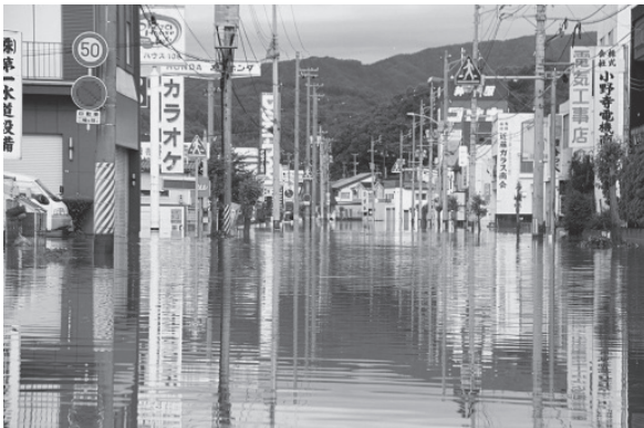
写真－5 市内の被害状況 国道106号冠水状況