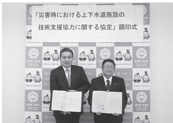
写真-9 宮古市と水コン協東北支部との災害時支援協定調印式