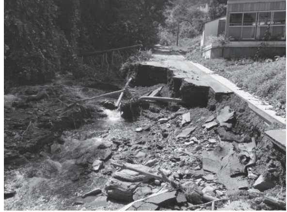
写真－2 上川井地区配水管