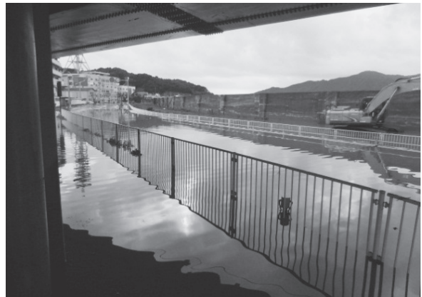
写真－6 国道106号冠水状況