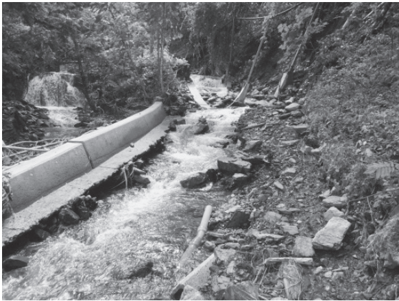
写真－3 上川井地区導水管