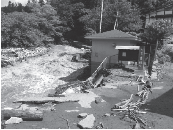
写真－1 和井内ポンプ場