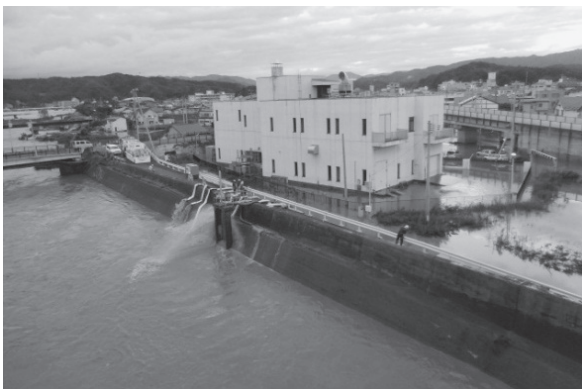
写真－7 ポンプ車による排水状況