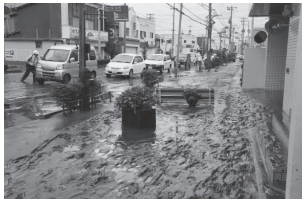
写真－8 市道の水が引いた後