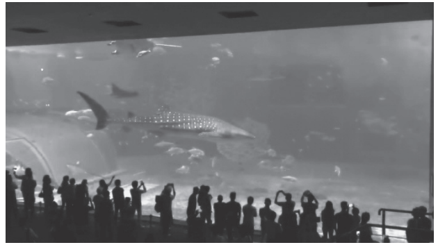
写真-2 社員旅行 沖縄 美ら海水族館にて撮影

年に一度、社員全員で社員旅行にいきます。コロナウイルスの影響もあり昨年は中止となりましたが、沖縄や北海道など様々なところに行きました。会社ではスーツ