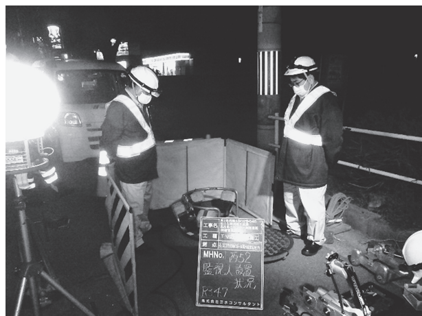
写真－1 調査業務での作業風景（管路調査業務）

調査後の診断について、最近は判定基準や診断方法について理解ができるようになり、顧客に少しずつ説明できるようになってきたところが1年間で成長できたと思うところです。