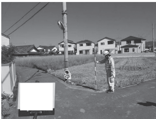
写真-2 実施設計業務での作業風景（測量）

この業務は私のいる部署では非常に多く実施しており、たくさん経験して早く一人前になりたいと思っています。