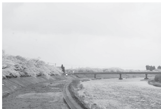
写真-1 施工場所付近の桜

水道管の設計をしていると自分が設計に携わったものを見ることのできる機会はあまりないかと思えます。私は今年の春、撤去される前の仮設管と満開の桜をみるため現地に足を運びました。初めて自分が関わったものを目にしてとても感動しました。