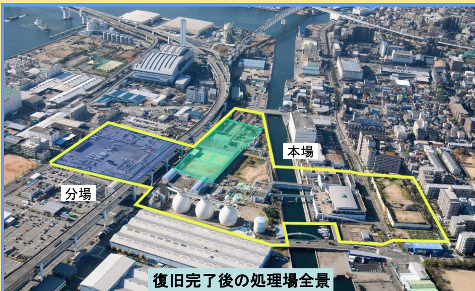
復旧完了後の処理場全景