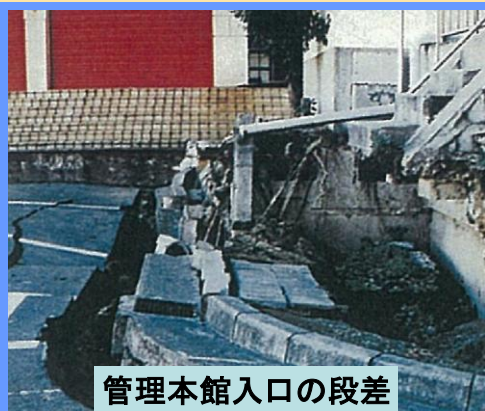
管理本館入口の段差