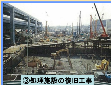
③処理施設の復旧工事