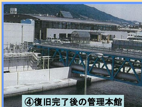
④復旧完了後の管理本館