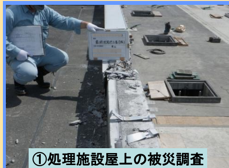
①処理施設屋上の被災調査