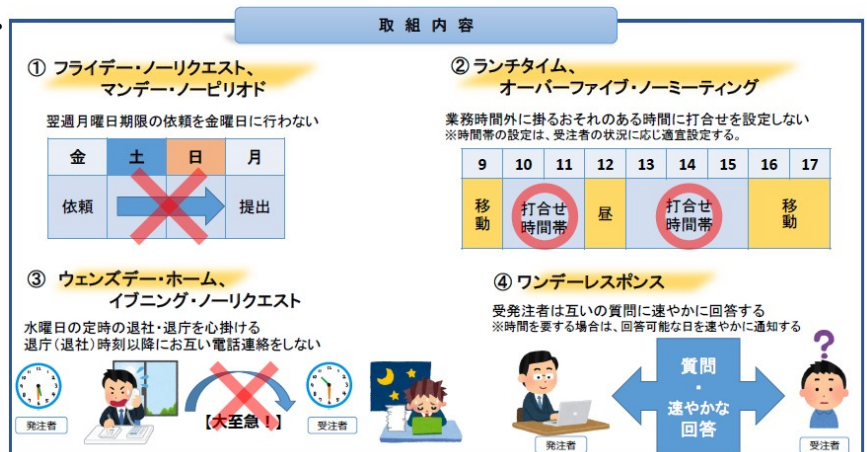
図-1 ウィークリー・スタンスの取組内容

受発注者で1週間のルールを定め、計画的に業務を履行しつつ業務環境を改善することで、設計業務等の品質を確保するとともにワークライフバランスを推進し、魅力ある仕事、現場の創造に努めることを目的とする。