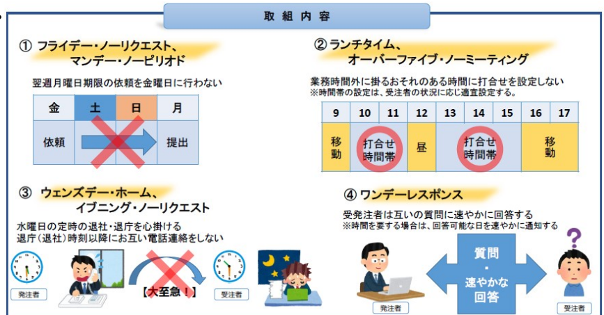
図-1 ウィークリー・スタンスの取組内容

受発注者で1週間のルールを定め、計画的に業務を履行しつつ業務環境を改善することで、設計業務等の品質を確保するとともにワークライフバランスを推進し、魅力ある仕事、現場の創造に努めることを目的とする。