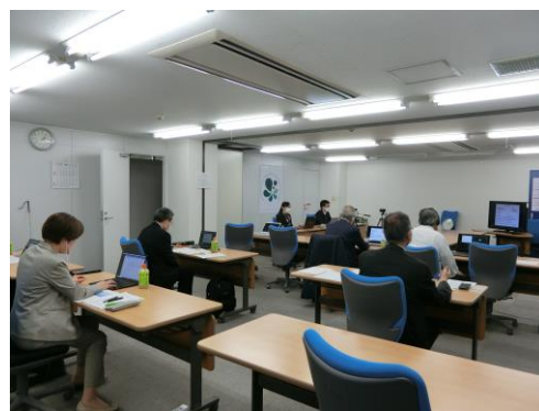
働き方改革セミナーの様子

働き方改革関連法が施行され、水コン協会員の企業においても様々な取り組みが行われています。水コン協では、令和元年度より「働き方改革セミナー」を開催しており、令和4年度はzoomウェビナーにより、ダイバーシティ及び健康を考慮した働き方についての講演を行いました。