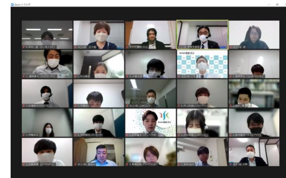
若手社員研修会 (関東支部)