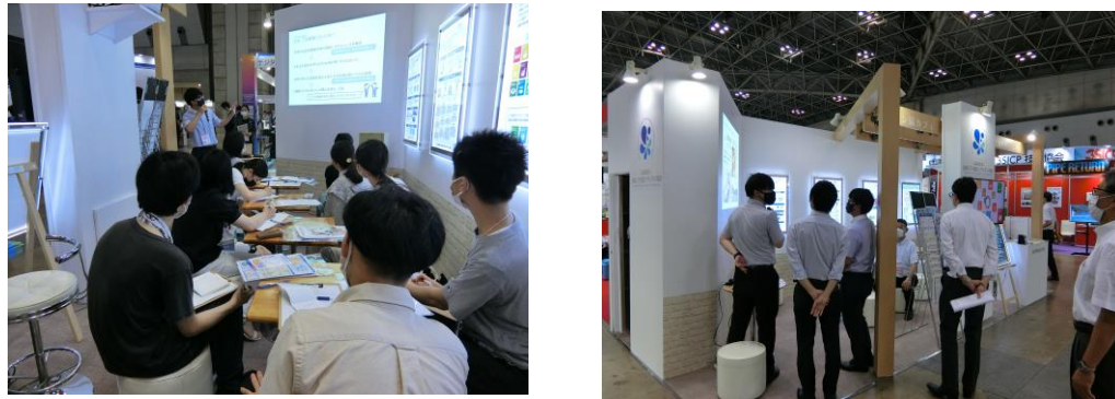
下水道展出展ブースの様子

また、学生向けに水コンサルタントの魅力を伝える企画「水コン協カフェ」を行い、就職活動中の多くの学生の参加がありました。