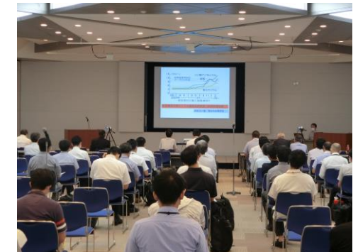
「コンサルタントにおける脱炭素の取り組み」講演会