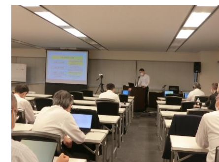
災害時支援者育成講習会